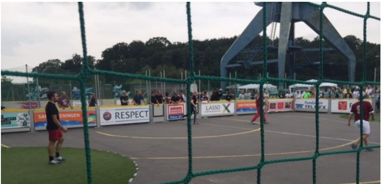
Billedet er fra 2017-udgaven af de åbne fynske mesterskaber i gadefodbold for udsatte