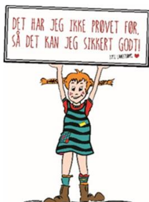
Institution Bolbro - Højstrup

Børneinstitutionen Bolbro – Højstrup består af 8 børnehuse af forskelligartet karakter, herunder børnehave, ressourcehus, integreret børnehus og vuggestuer.