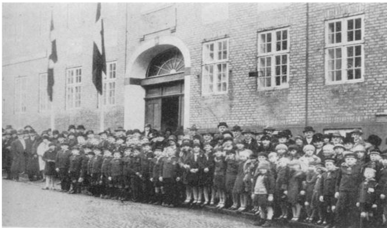
Fra Stiftelsens 125-års jubilæum i 1929