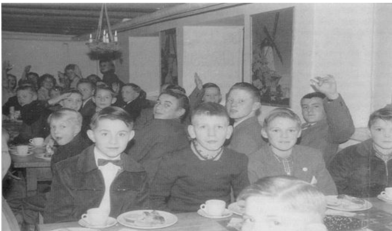
Kun Lahnbornene måtte komme den 10. december - 1958