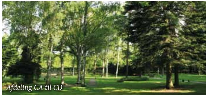
Afdeling CA til CD

Ved siden af urnefællesplænen ligger 4 afdelinger til urner, som markeres med plader i græsset. Enkelte fritvoksende træer kaster lette skygger på græsset.