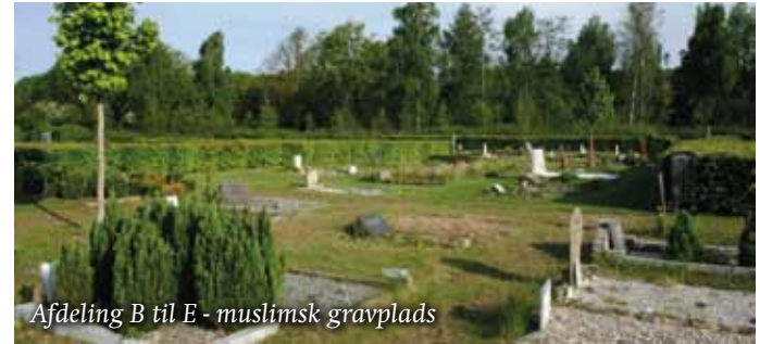
Afdeling B til E - muslimsk gravplads