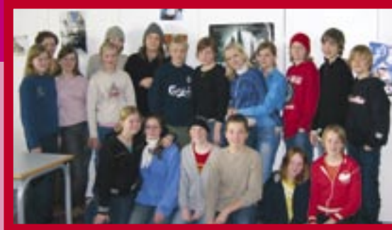
Tingkærskolens 7.B er årets børnejury.