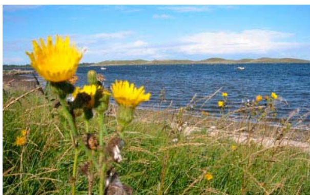
Udsigt til Stige Ø.

Biblioteket vil arbejde på at gøre relevant information tilgængelig om grøn by/tænkning dels via bibliotekets hjemmeside, og dels via udstillings- og medietilbuddet.