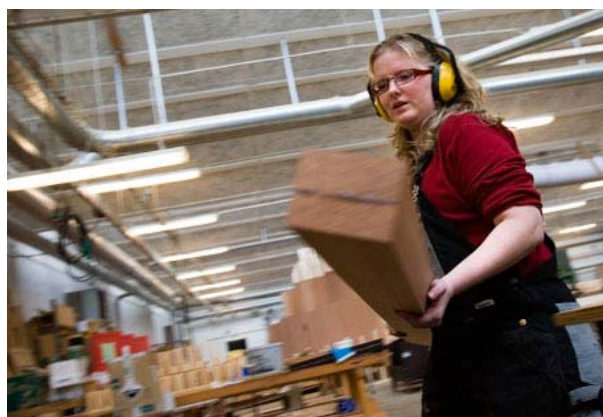
BYG - Sanderumvej.

Aktiveringsgraden, der i 2007 er på 45 pct., forventes via en målrettet indsats at kunne øges til 47 pct. i 2008. På grund af de ændrede refusionssatser vil udgifterne til kontanthjælp derfor kunne reduceres med ca. 10 mio. kr. årligt. Det er en forudsætning, at forvaltningerne kan skabe yderligere ca. 200 aktiveringspladser fra 2008 og frem. Der skal samtidigt være et specielt fokus på at få stoppet tilgangen af 18 årige på kontanthjælp.