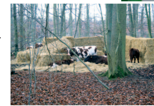
Køer i Kohaveskoven

6 I det tidlige forår er der travlt ved rågekolonien, som genlyder af magernes hæse kalden. Efter ynglesæsonen overnatter fuglene i Kohaveskoven, og om vinteren er der særligt mange fugle, da råger trækker ned fra koldere egne i Skandinavien.