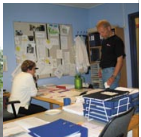
Egehuset - bydækkende specialinstitution.

Egehuset er et dagbehandlingstilbud til børn, der har behov for langvarige, målrettede pædagogisk og terapeutiske indsatser.