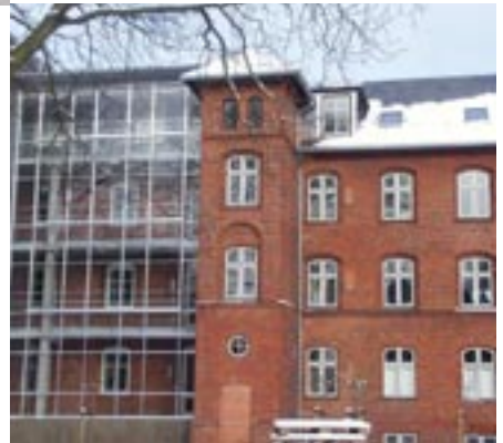
Botilbud for sindslidende på Solfaldsvej.

Borgere med fysiske eller psykiske handicap eller sindslidelser modtager individuelt tilpassede tilbud med mulighed for den nødvendige støtte og behandling. Tilbuddene gælder for voksne på områder som bolig, rådgivning og vejledning, beskæftigelse og fritid.