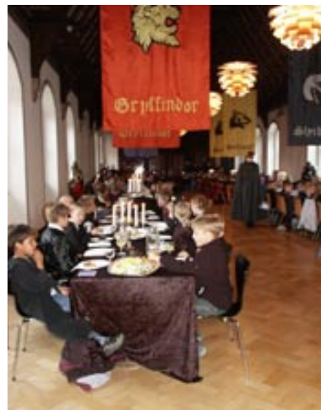
Harry Potter arrangement på Klosterbakken.

Integration og den interkulturelle virksomhed er på dagsordenen, og ikke mindst biblioteket spiller en væsentlig rolle for folks læring, som formidlere af information om det danske samfund og som kulturel aktør.