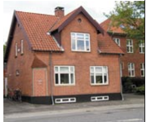
Familiehuset i Dalum.