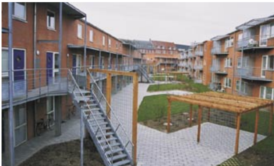
Ældreboliger - Tolderlundsvej.

tilpasses de aktuelle behov. Det indebærer blandt andet, at lejeaftaler for ældreboliger med private investorer skal revurderes i forbindelse med de enkelte aftalers udløb med henblik på tilpasning til den fremtidige boligpolitik og efterspørgsel.