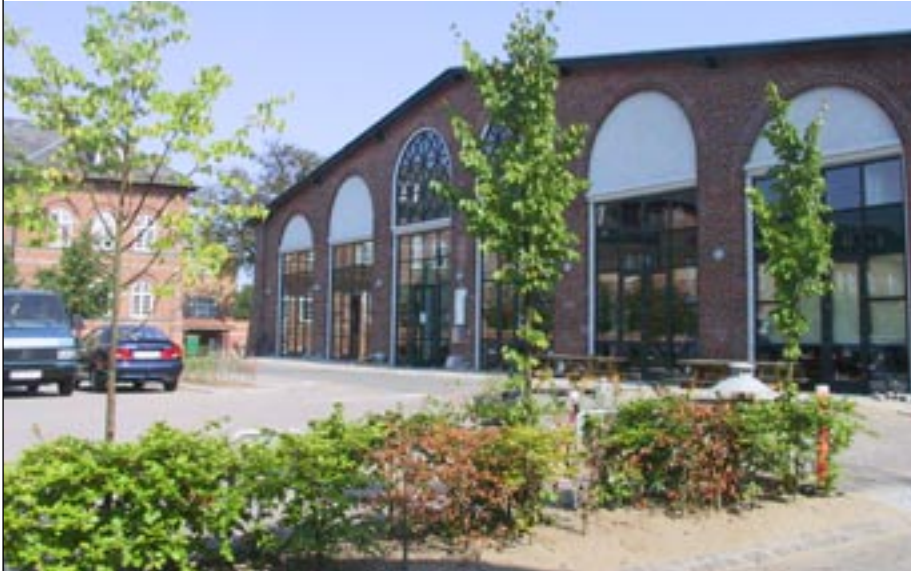
Kulturhus for psykisk handicappede på Rytterkasernen.