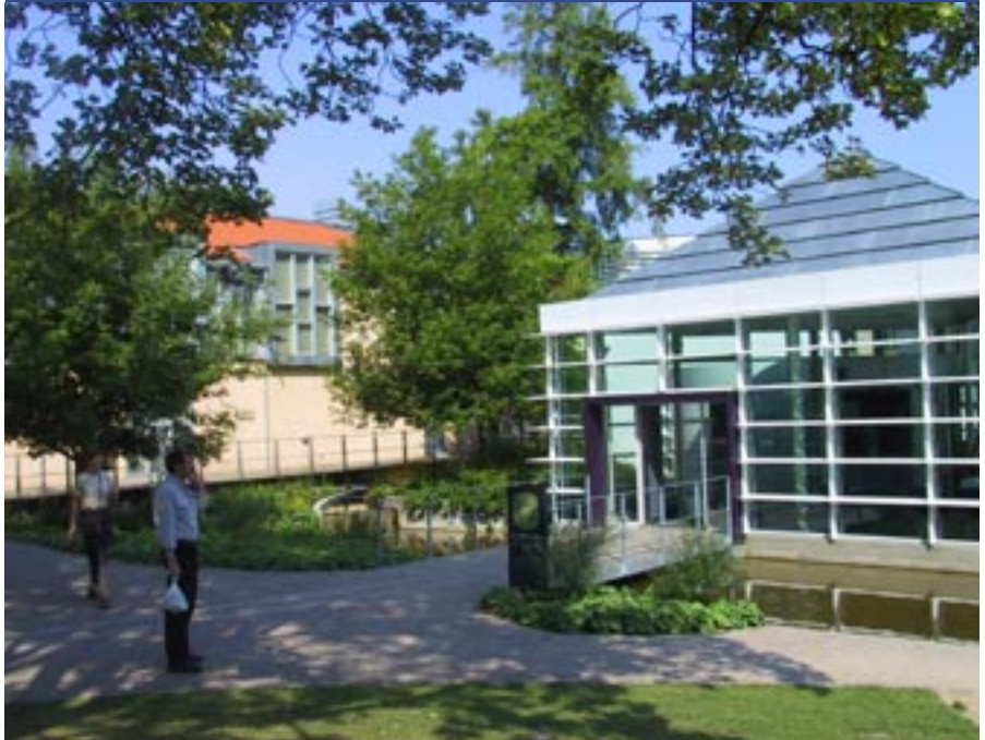
H.C. Andersens Hus.

På Bymuseet Møntergården vil der i de kommende år blive eksperimenteret med en ny Odense-udstilling, der skal pege frem mod etablering af et egentligt historisk center.